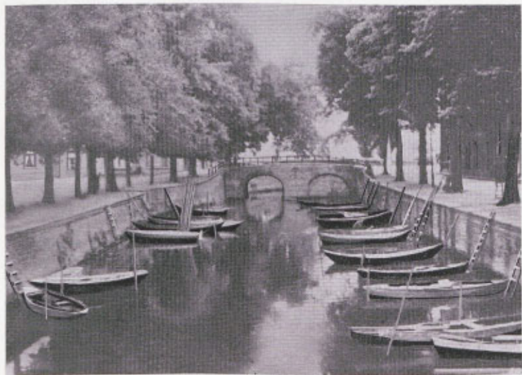
Het Oorgat voor de restauratie.